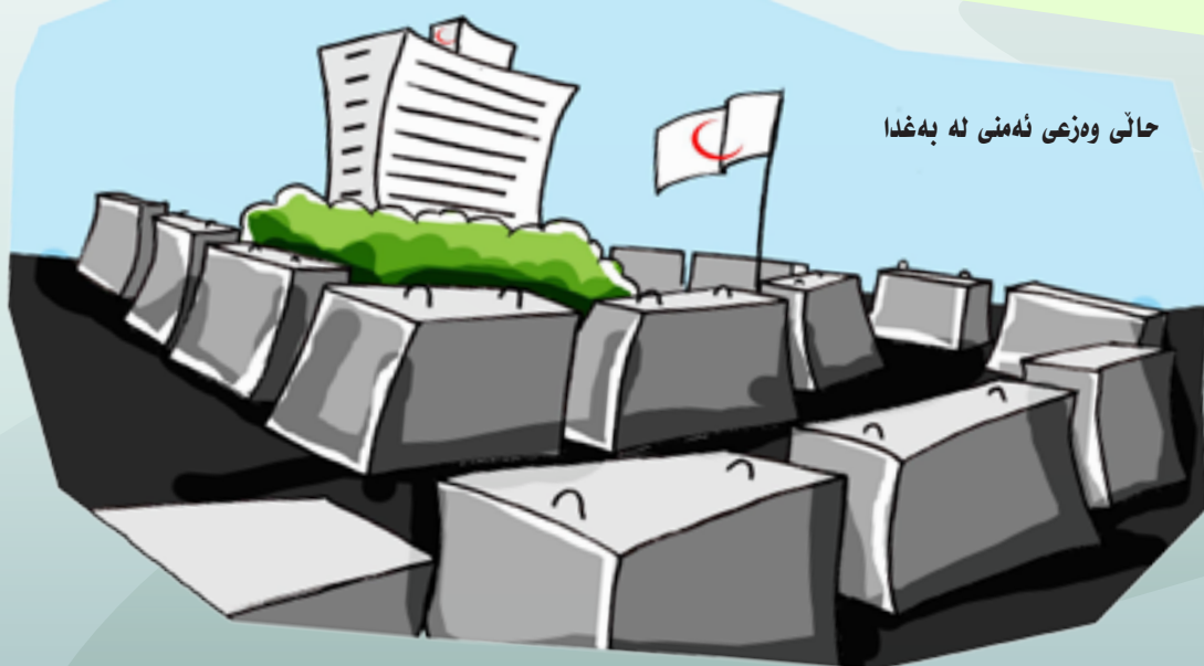
حالی وه زعی ئه منی له به غدا