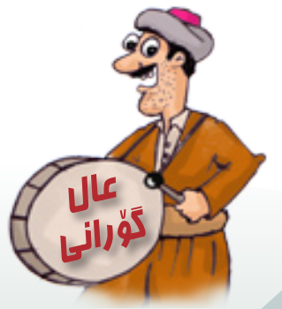
ئەحە ی دەهۆل

ئای لە دوور له دوور له دوور مال له دوور دێیه به شهو خهلك ئیزعاج دهكهم سێ خهتم پێیه نازتبی و نازتبی ئەمنه گیان نازتبی نانت نه بی بیخۆی بهس نهوت وغازتبی تۆکه چاوت هه لدینی هه زار دل دهسوتینی چونکه عایدی حیزبی دوومه عاش ئەکرمتینی ئامان میم گورجی سوخمه نارنجی ئەبیه م بۆ شای ئازیز دۆشکه و ئاریجی له منالییه وه خۆشم دهوئیت تاکوو ئەمرۆ سالانیکه مهعاش ئەخۆم من له جیی تۆ نازت دهکیشم چاوکال چونکه نازداری ئەبم به گۆرانییژ له تاو بیکاری هۆکاکی پێشمه رگه شۆرشگیزی قاره مان تهنها مهعاشی تویه بۆته لوقمه ی بن ددان ئیواریه و دهمه گهری شه قامه کان مه هژیننه دلنیا به ته عین نابی شه هاده کت بسوتینه هه لپه رنه نازه به و چاوه بازه کاره بام نه بوو شهوی سالی تازه!!