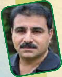
تایه ت کریم موده ریس بړ گپ دینورسی

هندي، يان دوو ههند له خه لکي حهزي زوريان به وديه شت به کوردي بکن و، به په تي قسه له سهر وه زع بکن، که چي زورجان ناگيان له وه نيه به پای په تي که وتوونه ته ناوی و وهک شیت و هارو هاج ده ست له مومته له کاتي گشتي نه وده شین، نهم صنفه نهمه لي زوريان به ژيان ههيه، ودها دسه سريان له بن راخستوو و نه زانن ناوی نهمه لیان خوار دوته وه و به له زگه يک تاريخه کونه کيان لابر دووه، که تا گه ييوه ته کوردستان که عاده ئیکسپا يه ربووه، له سهر يان نووسيوه نهمه صهنه تي دوو مانگ له موه و به ره!