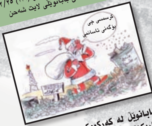
بابانوئل له که رکوی کاریکاتیری عه لی ده رویش.. ل ۱۱