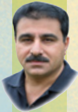
تایهت بزگه پر دهینووسی کاریم موداریس

دهتو وهره دهبابه له نیو خه لکا ببینه، خویان به بۆری ملییه وه هه لواسیی، یان وهک ئوتوبیس نه فهریان لی بار کردبی! بزانه مه نزهریکی چه ند عهنتیکه یه ئیتیفاقی نیوان مشک و پشیلهی که ههردوویان خه و به راکردنه وه ئه بینن، یه کیکیان بۆ خواردن و ئه ویتریان بۆ نه خوران. دهوری ههریهک له فاعیل و مه فعلوبه یی سهیره له گۆره پانی ئه م ژینه هینه! که فیعه ن ئه لئی بۆ ته جره به ی خواردن و مقاومه ی نه خوران هاتوته دامه زراندن.