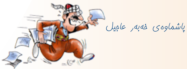
پاشماوهی فەبەر عابیل

بۆ دُنیا بون لهو خه به ره داشکاو هه لاپه ره یه که می گۆقاره که مان، سەردانی هۆلی په رله مانی عیراقمان کردو ته ماشای وه زعه که مان کرد، له بهر زۆری لیقه و به تانی و پیخه فی جۆراوجۆر ریی ریدار نه بوو تا بتوانین بچینه ژوره وه، تومەز هه مووی جیگه و بانی په رله مان تاره کانه و زۆر به یان له ترسی برینی ملیۆنه که به شه ویشدا له وئ دهخه ون، ده لئین نه وه ک فریای دهوام نه که وین، راستیش ده که ن دنیا هه زار مقه دده ره!!