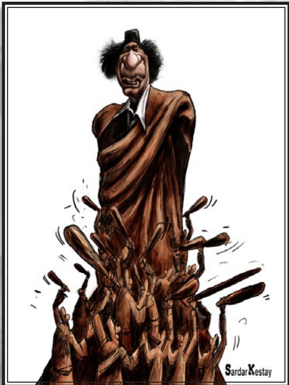
بی توانج کاریکاتیر: سهر دار کیسته یی

www.gep-media.com Email:www.gepgovar@yahoo.com سوبعت تاسهر ئیسقان