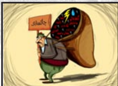
کاریکاتیری: سالم سه لیم .. ۳۹ل.

www.gep-media.com Email:www.gepgovar@yahoo.com سوبعت تاسهر ئیسقان