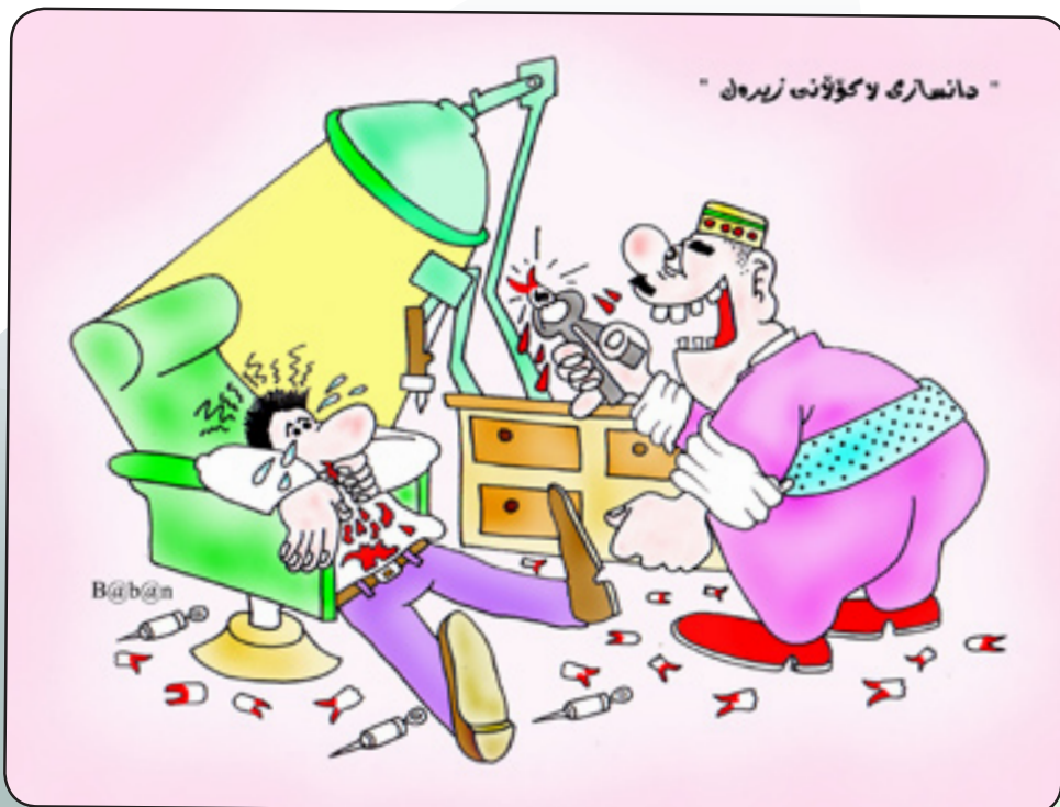
بابان لە سەلىمانىيە ۋە دەينىرى