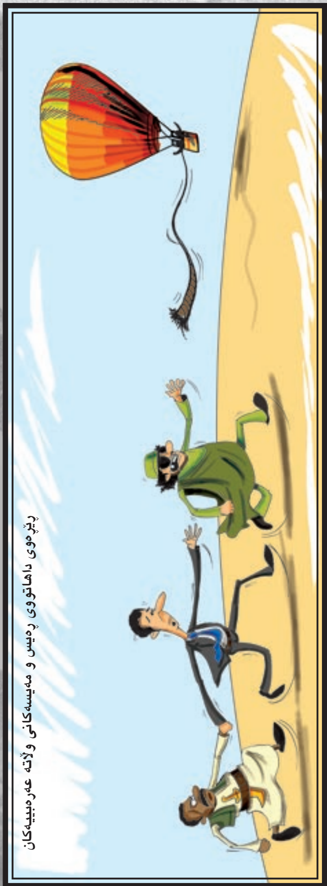
پژموی داهاتوی رهیس و مهیسهکانی ولاته عه ره بیبهکان