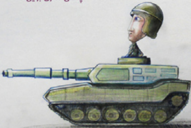
پشتی مه زان بوی