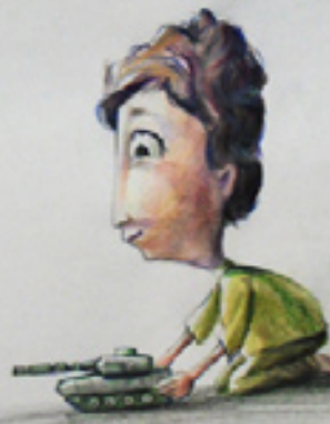
دهما پی زاروی