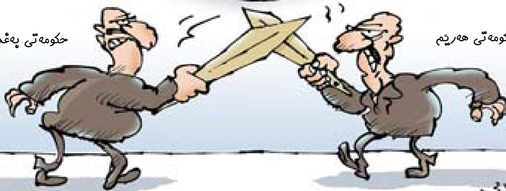
کاریکاتیږی: خضیر الحمیری