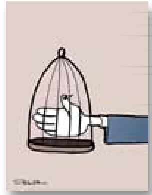
کاریکاتیږی: پهروهه ل ۲۴

ئا بهم بهره جهژنانه.. زرمه و فرکان فرکانه جو کلپتی نور کجا و ئېران.. راجیمه و ئۆپ بارانه له سه عریبه و جهلهولا.. کورد راوئنه ئینن بو ئه ملا به غراوهک که ره کی شه بهت.. ئه لفی نالی به فهولا