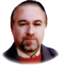
رۇستەم زادە - نامۇ -