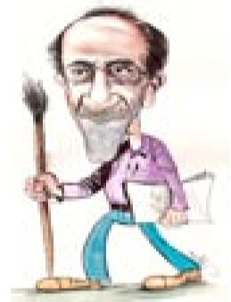
عه لی ده رویش ریپورتازی نهم ژماره یه ژن کوشتن